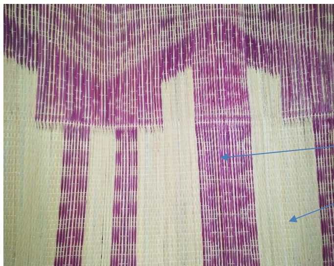
Natte en Chamaerops beige texture rouge