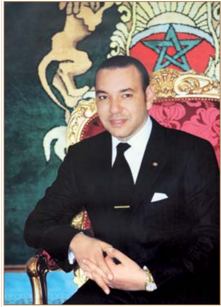
أمير المؤمنين صاحب الجلالة الملك محمد السادس أيده الله